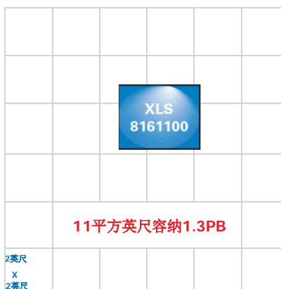
确思达XLS-8161100: 11 平方英尺容纳1.3PB

确思达有各种配置的XLS磁带库可供选择，以满足客户的各种容量需求。现在投资XLS不但可大幅降低占地面积，还可使您的容量在未来几年扩大四倍。如需了解更多详情，请联系确思达或授权经销商。