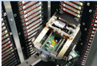
在21英寸的水平移动距离中，XLS机械臂可访问超过3,200个磁带，以满足快速访问和高可靠性的需求。

从磁带库资源模块（LRM）开始，一个完整独立的磁带库是可扩展系统的基本单元。随着您需求的增加，可添加内存扩展模块（MEMs），其可在非常紧凑的空间内提供大量额外的磁带盒插槽。